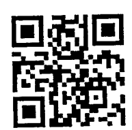
เอกสารประกอบการสมัคร MEXT SCHOLARSHIP 2020