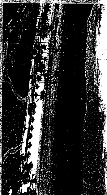
NHA TRANG CITY is a seaside town, also the capital city of Khanh Hoa Province — on the South Central Coast of Vietnam (it's about 1200 kilometers south of Hanoi).

09 September 2015 08:00 - 08:30 Registration 08:30 - 09:00 Opening Ceremony 09:00 - 09:45 Keynote Speaker 09:45 - 10:00 Coffee Break 10:00 - 12:00 Parallel Session I 12:00 - 13:30 Lunch 13:30 - 15:00 Panel Discussion 15:00 - 15:15 Coffee Break 15:15 - 17:00 Parallel Session II 17:00 - 17:30 Closing Ceremony 18:00 - 20:30 Reception Dinner & Cultural Show 10 September 2015 08:00 - 17:00 Cultural Visit 18:00 - 20:00 Dinner